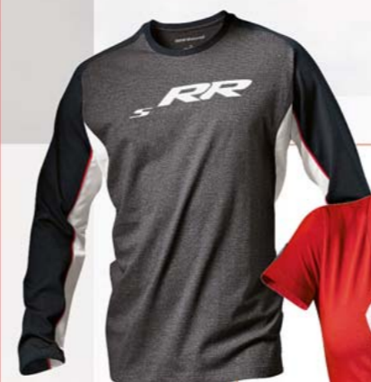
T-shirt manches longues DoubleR homme

LA VITESSE, UN IDÉAL. INSPIRÉE DE LA BMW S 1000 RR, PREMIÈRE SUPERSPORTIVE DE BMW, LA COLLECTION RR TROUVE DANS LA VOIE DE DÉPASSEMENT UN PARFAIT TERRAIN D'EXPRESSION. SES COULEURS EXPRESSIVES ET SES MOTIFS ORIGINAUX INSUFFLENT UNE DOSE D'ADRÉNALINE DANS VOTRE QUOTIDIEN.