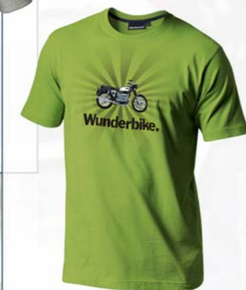
T-Shirt Wunderbike homme