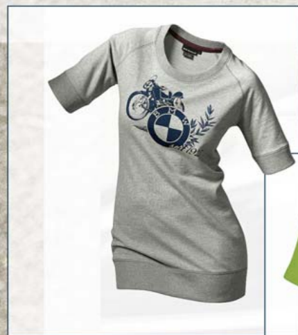
T-Shirt Heritage femme

LA TRADITION JUSQUE DANS LA MOINDRE FIBRE. LA COLLECTION HERITAGE CÉLÈBRE LA RICHE HISTOIRE, L'ESPRIT NOVATEUR ET LE MYTHE DE BMW MOTORRAD. LA LÉGENDE REVIT GRÂCE À DES MOTIFS RÉTRO ET DES ACCESSOIRES VINTAGE.