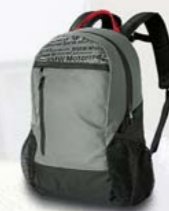
Sac à dos BMW Motorrad

96 % coton, 4 % Lycra, noir, femme XS - XL