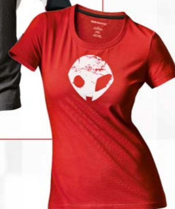
T-Shirt DoubleR femme

95 % coton, 5 % élasthane, rouge, XS - XL