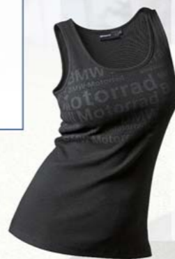
Débardeur BMW Motorrad

piqué 100 % coton, noir, bleu, homme S - XXXL