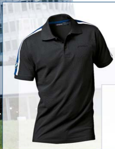
Polo BMW Motorrad

piqué 100 % coton, noir, bleu, homme S - XXXL